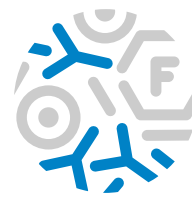
Factor de Transferencia